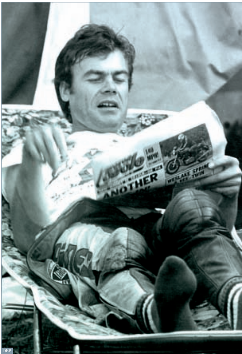
Steht mein Name in der Zeitung?

Noch immer gehandicapt, reisten Braun und sein Team drei Wochen spä-