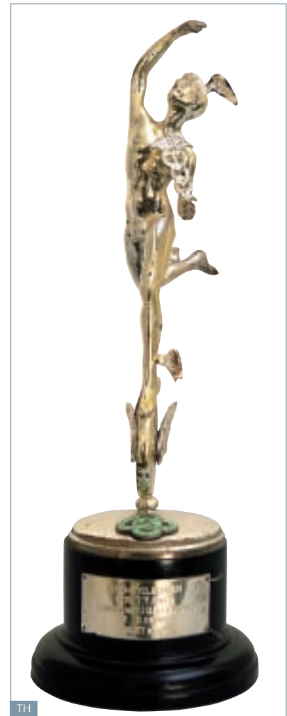
Siegerpokal der TT

Bei dem Viertelliter-Motorrad aus Zschopau wurde ein Kolben zu heiß und brannte sich letztendlich fest. Mit der auf