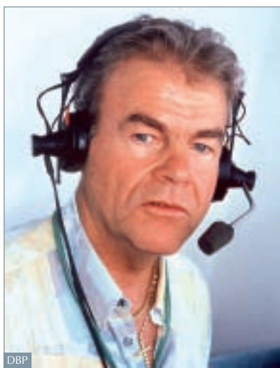
... und als gefragter Moderator bei ARD, ZDF, Eurosport und MDR