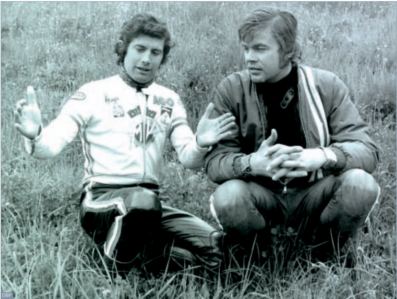
Ein Fachgespräch unter Weltmeistern: Giacomo Agostini und Dieter Braun

nahm er das Rennen noch einmal auf, schied aber wenig später mit Fahrwerksproblemen aus.