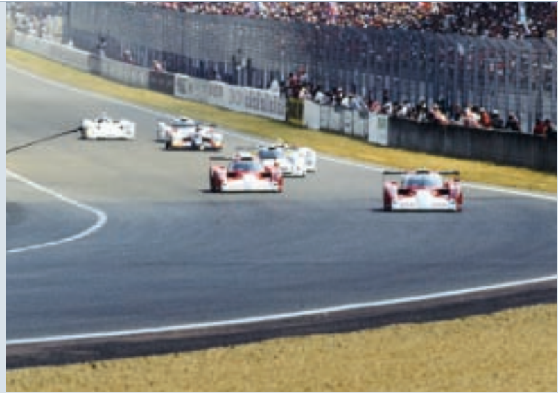
Toyota dominierte das Rennen