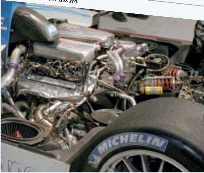
Motor-Getriebe des R8