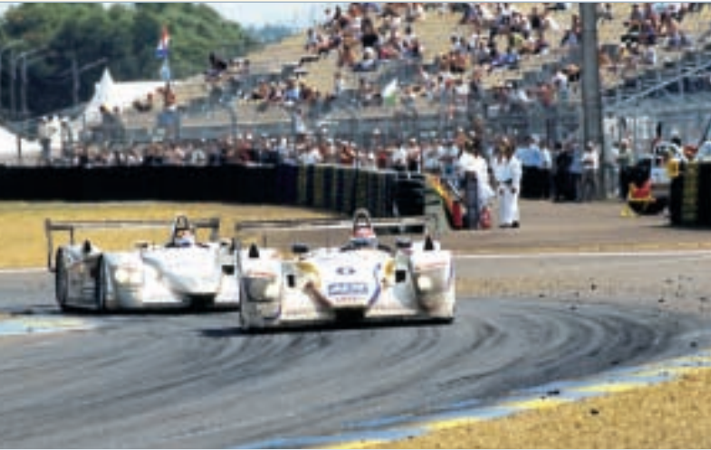
Emanuele Pirro vor Seiji Ara