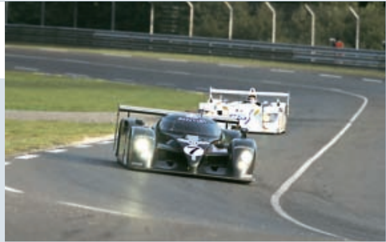
Lehto im Champion-Audi hinter dem Bentley von Capello/Kristensen/Smith

den Weg an die Sarthe. Nach einem Jahr Pause war Champion wieder dabei, die mit J.J. Lehto, Emanuele Pirro und Stefan Johansson ein erfahrenes Trio an den Start brachten. Audi Sport Japan hatte nachgerüstet und sich einen R8 der letzten Baureihe von 2002 angeschafft. Neben Goh-Stammfahrer Seiji Ara verrichteten Jan Magnussen und Marco Werner den Dienst am Lenkrad. Mit Mika Salo und Perry McCarthy gab es auch zwei Formel-1-erfahrene Piloten im dritten R8, der von Audi UK eingesetzt wurde. Wobei dies für McCarthy nur bedingt zutrifft, bei elf Versuchen schaffte er es nie weiter