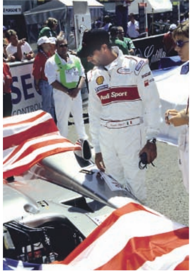
Emanuele Pirro begutachtet einen Cadillac

Er war begeistert: „Der R8 ist dem 99er-Auto um Lichtjahre voraus!“