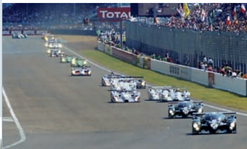
Die Bentleys gehen sofort in Führung