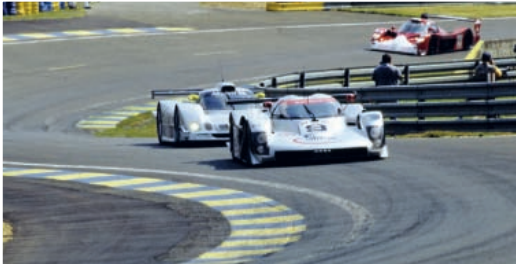
Alle drei Coupés kamen nicht ins Ziel