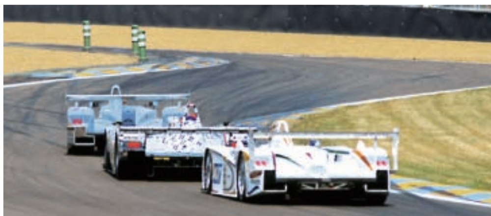
Biela, Lammers und Lehto im Clinch