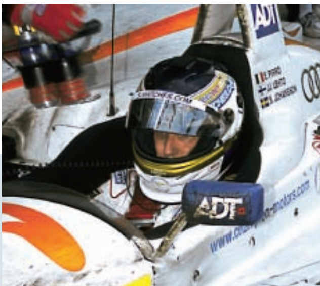
Johansson an der Tankstelle

Der Wettbewerb war auch 2003 eher dürrftig, wenn man über die Grenzen des Volkswagen-Konzerns hinaussieht. Zwar war erneut der Kleinserien-Hersteller Panoz mit seinem donnernden Frontmotor-LMP am Start, doch der