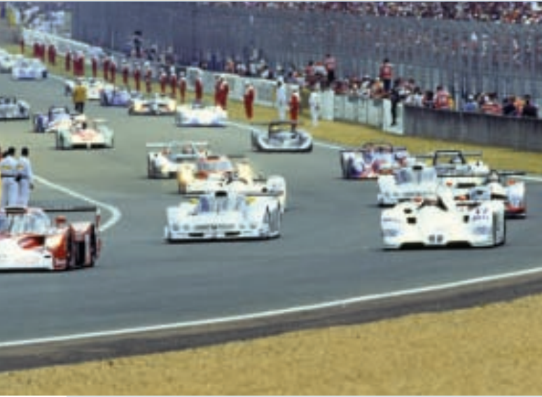
1999 war das bestbesetzte 24-Stunden-Rennen