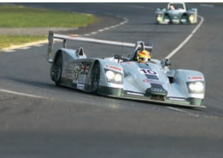
Frank Biela war schnellster Audi-Pilot im Training