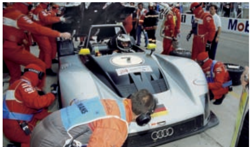
Laurent Aiello 1999

Wechsel zum Opel DTM-Team begann der sportliche Abstieg des Laurent Aiello. Die Rüsselsheimer schafften es auch im fünften und sechsten Anlauf nicht, ein konkurrenzfähiges Auto auf die Räder zu stellen. Zwei vierte Plätze waren die magere Ausbeute in 21 Rennen, für einen der schnellsten Tourenwagenfahrer der Welt. Ende 2005 zogen die Verantwortlichen in Rüsselsheim die Reißleine und beendeten die erfolglose DTM-Vorstellung. Laurent Aiello hätte ein würdigeres Ende seiner Karriere verdient.