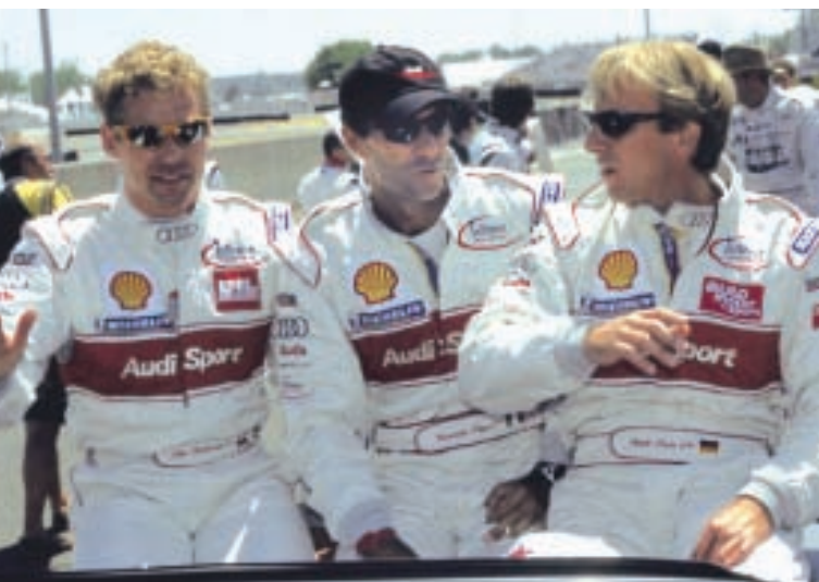
Tom Kristensen/Emanuele Pirro/Frank Biela